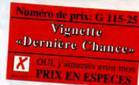
TABLEAU RECAPITULATIF • PRIX EN ESPECES

Veuillez détacher ici et coller sur le bon de commande.