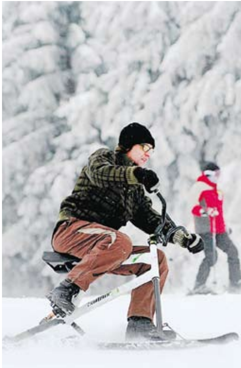
Snowbike C'est beaucoup moins difficile à maîtriser que ça en a l'air! Deux skis courts peuvent même être ajoutés aux pieds afin d'obtenir plus de stabilité. Les snowbikes, qui se chevauchent sur le domaine skiable, se louent auprès de plusieurs écoles suisses de ski, qui proposent aussi des cours. Parmi elles, celles de Crans-Montana et de Grächen (VS). → www.essmontana.ch → www.snowbikegrachen.ch