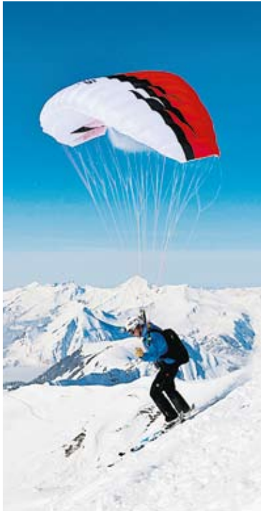
Speedflying Pour pratiquer ce sport – qui n'est pas sans risque –, le brevet de parapente avec une extension pour le speedflying est nécessaire. Formations et informations auprès de la Fédération suisse de vol libre (FSVL), dont certaines des écoles affiliées proposent des vols d'initiation. → www.shv-fsvl.ch

En pratiquant la première, on peut dépasser les 50 km/h, à l'aide d'une voile spéciale, sur des pentes prévues à cet effet. Les libéristes skient tout en volant: une sensation exaltante! Avec le snowbike, on descend la piste assis sur un engin qui n'a pas de roues, mais des lattes. Enfin, les fans de kitesurf trouveront son pendant hivernal à travers le snowkite. A ski ou à snowboard, le vent qui souffle dans la voile fait décoller et permet d'exécuter toutes sortes de figures. Tout ça, bien entendu, avec un casque. La qualité de certains modèles est analysée ci-dessous. -CAROLINE GOLDSCHMID